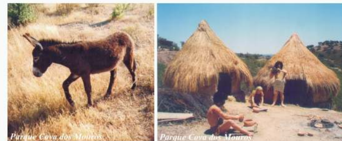
Parque Cova dos Mouros

Para continuar o PR, siga pelo caminho de terra batida principal, até à E.M. 506 (Km 5,1). Chamamos a sua atenção para a magnífica vista sobre a Ribeira da Foupana. Chegado à E.M 506, continue a sua caminhada, de acordo com as orientações da sinalização do PR. Em todo o caso, o caminho a seguir é o que se avista em frente, do outro lado da Ribeira da Foupânica, que passa junto a uma casa em ruínas (sítio das Plenganas).