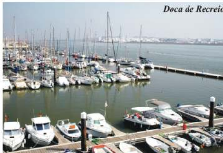
Doca de Recreio