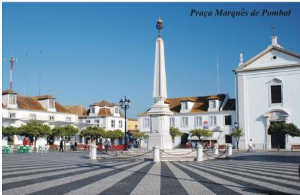
Praça Marquês de Pombal

Visite o interior da Igreja, onde se destacam os retábulos das capelas laterais de gosto "rocaille", um conjunto de imagens do século XVIII, entre as quais a de Nossa Senhora da Encarnação, da autoria do escultor Machado de Castro e os vitrais instalados na década de 40, do pintor algarvio Joaquim Rebocho.