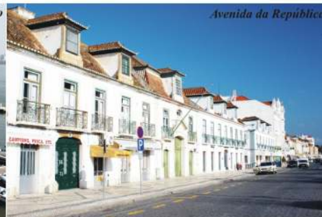
Avenida da República